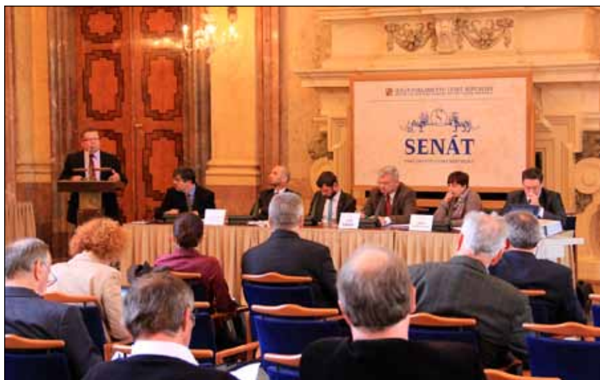
Seminář Hlubinné úložiště a role veřejnosti