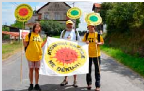
Z dřívějších ročníků pochodu

Pod tímto názvem se koná tradiční akce pořádaná SDH Maňovice a o.s. „Jaderný odpad – děkujeme, nechceme!“ Start je 19. 7. od 13:30 v Pačejově Nádraží. Akce končí v Maňovicích na dračí louce, kde se koná večerní zábava. K poslechu a tanci hraje od 15 hodin Jiří Svoboda a od 19 hodin Millennium Music Band. Občerstvení zajištěno.