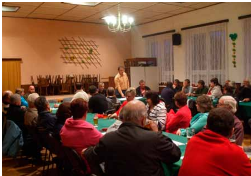
Problematika úložiště místní zajímá

Poslední víkendovou sobotu pořádá jistebnická osada Makov setkání pod širým nebem a pod heslem „Země jsme nezdědili od svých předků, máme ji vypůjčenou od svých dětí“. Chystá se hudba, program pro děti a hlavně informace o úložišti slovem, písmem i obrazem. Jeho povrchový areál by totiž podle plánů SÚRAO mohl vyrůst na místě, která je od louky, na níž setkání bude, bez nadsázky „co by kamenem dohodil“: začínal by u silnice mezi osadami Makov a Padařov a končil o stovky metrů dále těžebními tunely a tunelem pro zavážení radioaktivního odpadu. Pro SÚRAO je příznačné, že tento nápad se místním lidem nikdo z jeho zodpovědných pracovníků neobtěžoval oznámit. Dozvěděli se o něm z obrázku, který předloni SÚRAO omylem zapoměla v počítači jednoho z organizátorů besedy v nedalekých Božejovicích.