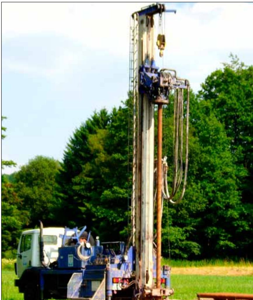
Kdy přijdou na řadu vrtné soupravy?