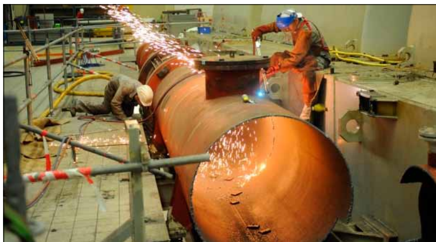
Demontážní práce ve strojovně odstavené jaderné elektrárny

„Umíme bourat“ – tímto sloganem hlásá provozovatel jaderné elektrárny, firma ENBW, co umí. Elektrárna měla být vlastně odstavena z provozu už v roce 2002, tak to alespoň předpokládal plán odstupu od jaderné energie, schválený v roce 2000. Pak se ale otevřela možnost přenést část výkonu nové elektrárny Phillipsburg 2 na staré zařízení, což znamenalo prodloužení životnosti o tři roky. V květnu 2005 byl ale definitivně