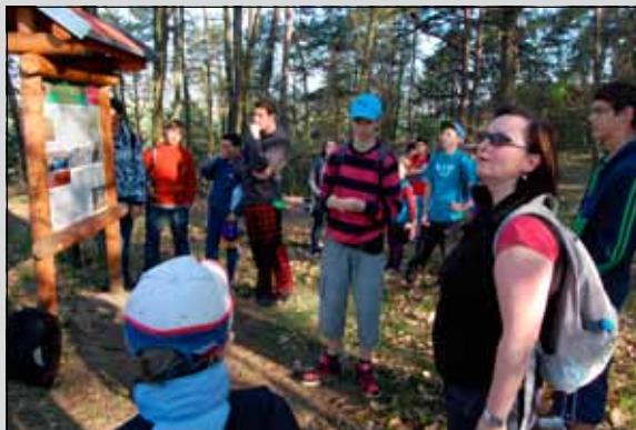
Z výpravy na Blatenský svah