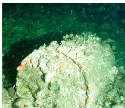
Sudy s jaderným odpadem na dně moří jsou tikající bombou

Německo podniklo první mezinárodní ponoření jaderného odpadu: v roce 1967 nechalo potopit radioaktivní odpad z jaderné – výzkumného centra Karlsruhe ve 480 sudech společně s britským a belgickým jaderným odpadem do Atlantiku. Celkem „utopily“ evropské státy v Atlantiku více než 220 000 sudů s jaderným odpadem na 15 místech Atlantského oceánu. Více než 28 000 sudů z toho množství se nachází v Lamanšském